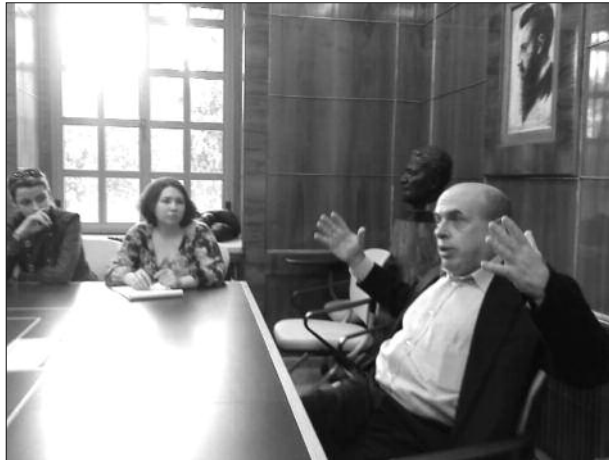
Натан Щаранский во время встречи с молодыми евреями из СНГ в зале, где находился тайник с документами. За спиной Щаранского – портрет Герцля, висящий на том месте, где была дверь в тайник с документами

но наиболее ценная для англичан добыча находилась во втором. Там были спрятаны документы о связях Хаганы с другими еврейскими организациями – ЭЦЕЛ и ЛЕХИ, адреса тайных убежищ, где скрывались руководители этих организаций, сражавшихся с ан-